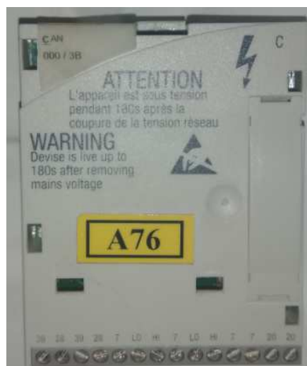
Лицевая сторона модуля

Для идентификации дополнительных модулей преобразователя частоты (модулей расширения входов/выходов, сетевых модулей и т.д.) необходимо фото модуля с двух сторон