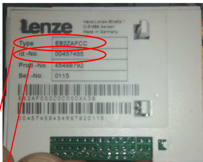
Обратная сторона модуля